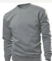
GYH grey heather