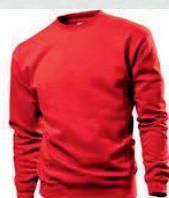
SRE scarlet red