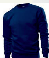
NAV navy blue