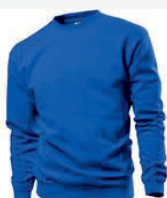
BRR bright royal